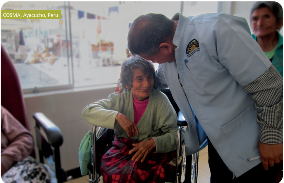
COSMA, Ayacucho, Peru

Fracarita International heeft een consultatieve status in de Economische en Sociale Raad (ECOSOC) van de Verenigde Naties. De ngo van de Broeders van Liefde steunt volledig de Duurzame Ontwikkelingsdoelstellingen (SDG's) van de Verenigde Naties.